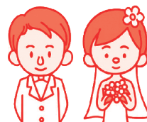
扶養していない娘夫婦